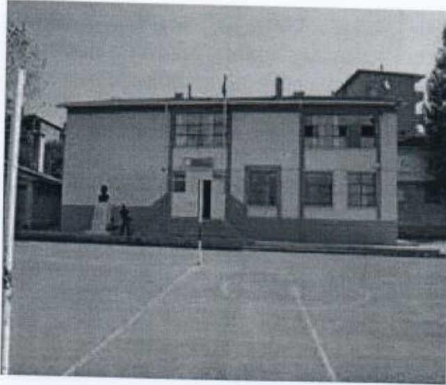
Okulumuzun Yeni Hali